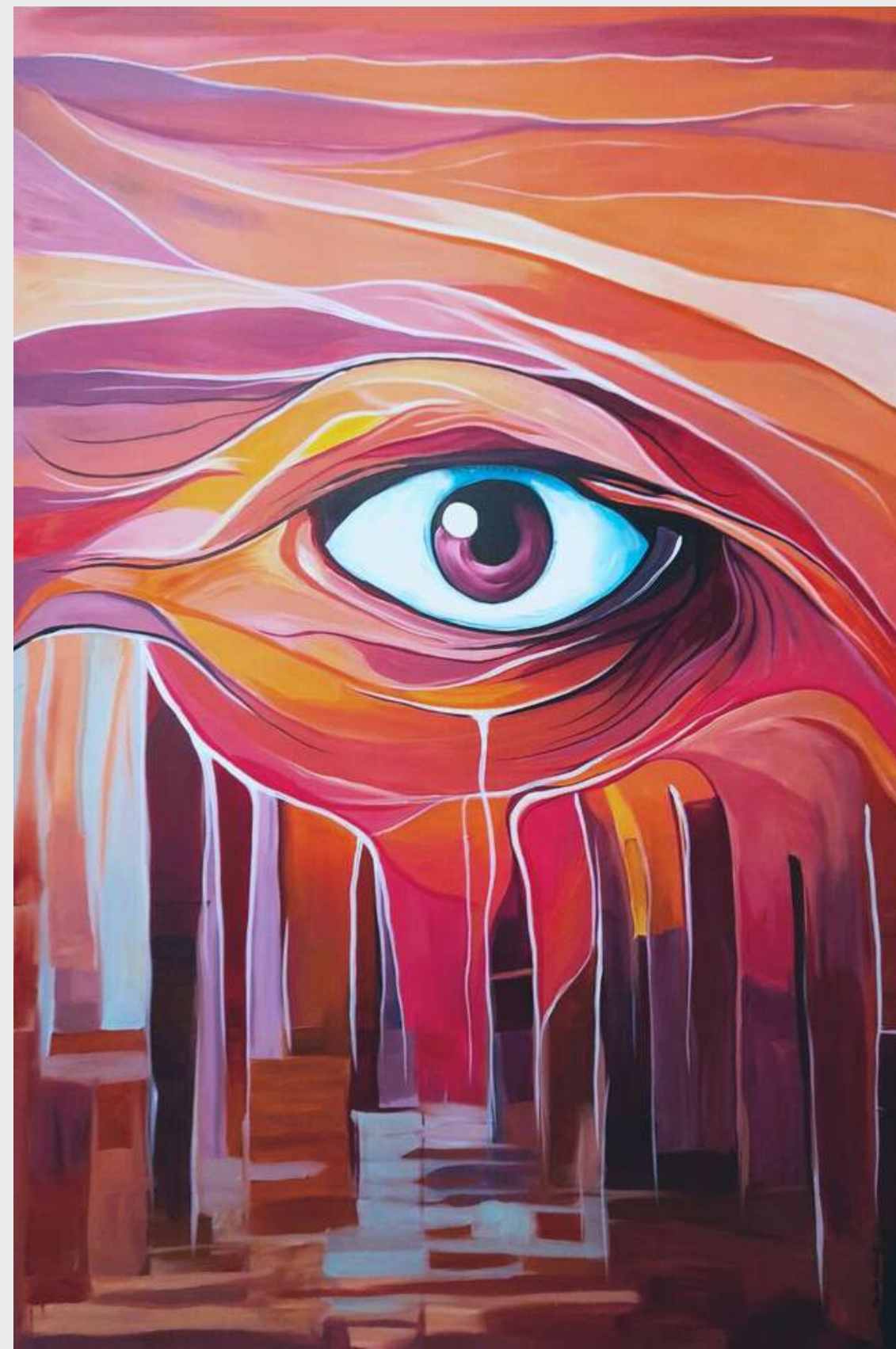
Piercing Violet Eye